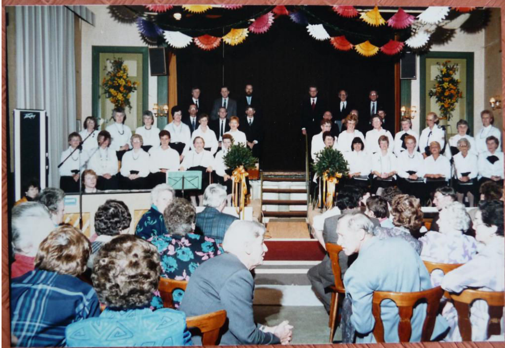
De eerste pioniers