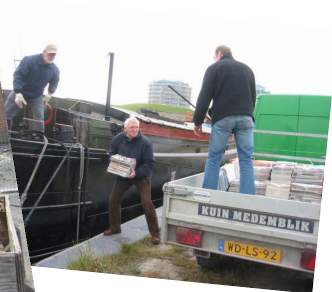
Hard werken voor de kas.